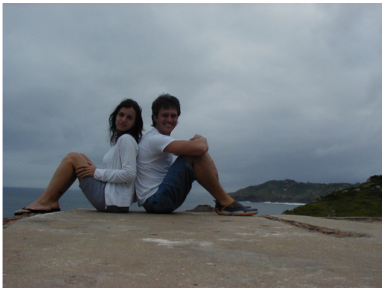
En esta foto mis padres estan en su luna de miel